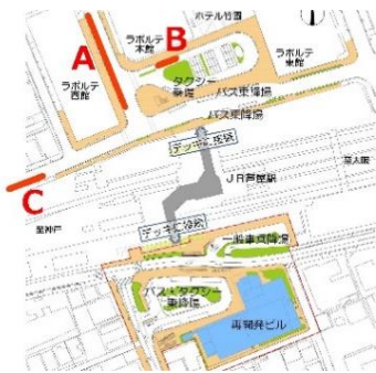
J R 芦屋駅南・北交通広場配置